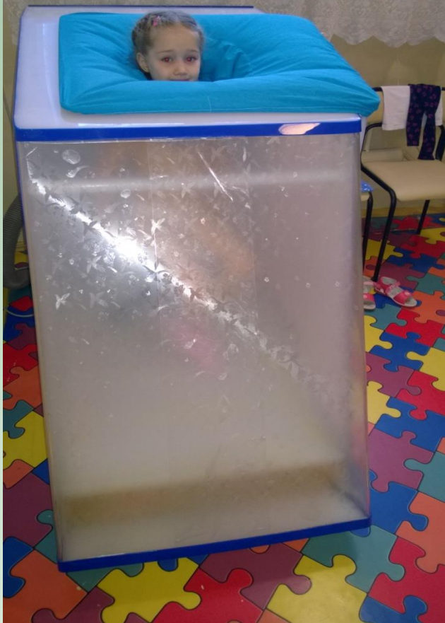
Сухая углекислая ванна